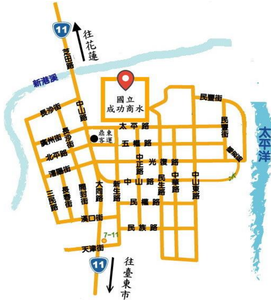
附圖一 承辦學校位置圖

網址 http:// www.ckvs.ttct.edu.tw 地址 961 臺東縣成功鎮太平路 52 號 電話 089-850011#230、280